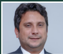
1º SECRETÁRIO Arthur de Jesus Brito Município de Tucuruí/PA